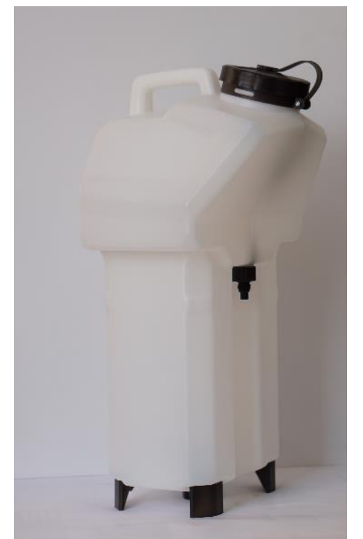
Бак для жидкости