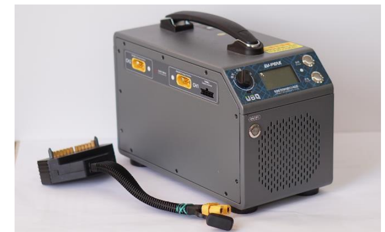
Зарядное для АКБ